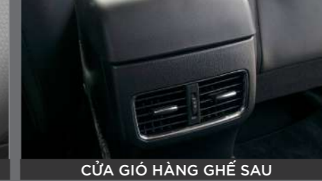
CỬA GIÓ HÀNG GHẾ SAU