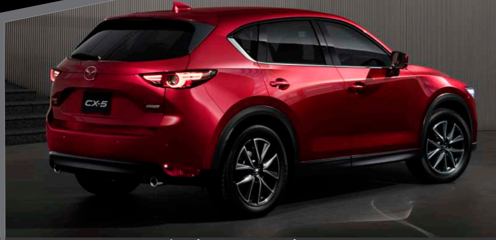
CỤM ĐÈN HẬU DẠNG LED / MÂM HỢP KIM 19"