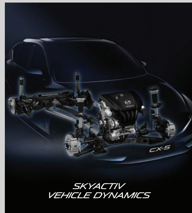
SKYACTIV VEHICLE DYNAMICS

Mazda CX-5 được phát triển toàn diện về công nghệ với mong muốn tạo mối liên kết cảm xúc giữa người và xe. Với triết lý Jinba Ittai, Mazda CX-5 dường như luôn thấu hiểu và phản ứng lại hoàn hảo theo đúng các yêu cầu từ người lái, mang đến một trải nghiệm lái hoàn toàn khác biệt.