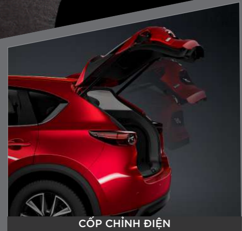
CỘP CHỈNH ĐIỆN