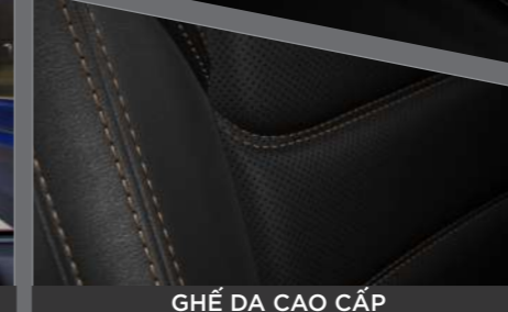
GHẾ DA CAO CẤP