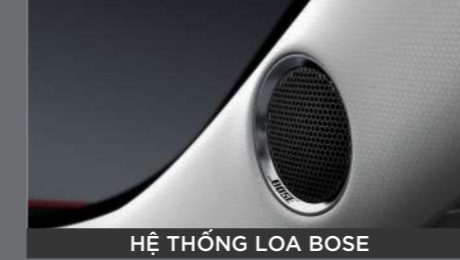
HỆ THỐNG LOA BOSE