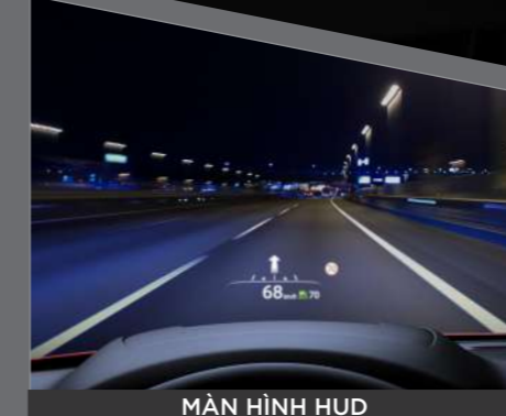
MÀN HÌNH HUD